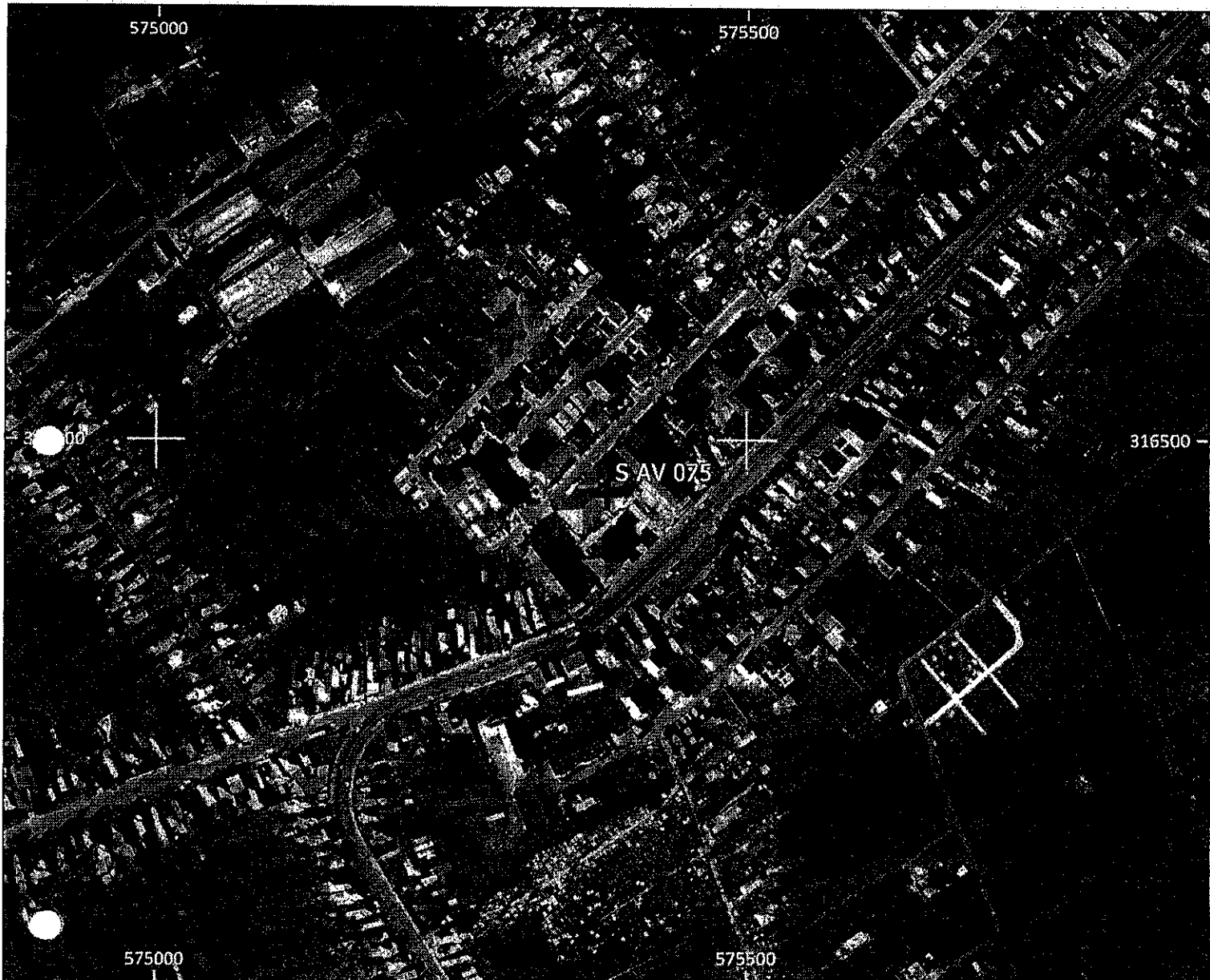
Amplasament sirenă - Faza HCL